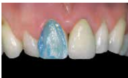
Tratamento da superfície**