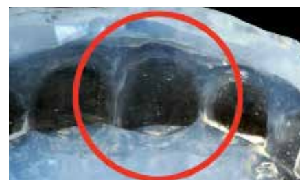
Certifique-se de que não haja defeitos na área envolvida na moldagem