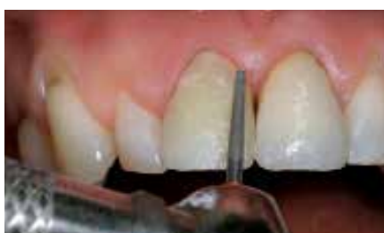
Acabamento do compósito: remova o excesso de material e faça o polimento**