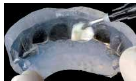
Aplicação do compósito, começando pela zona incisal e movendo-se na direção da borda cervical