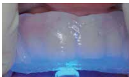
Reposicionamento da matriz feita com ELITE GLASS na cavidade oral, certificando-se de que não haja folgas entre a matriz e os dentes. Fotopolimerize através da matriz**