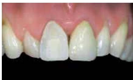
Preparação da faceta