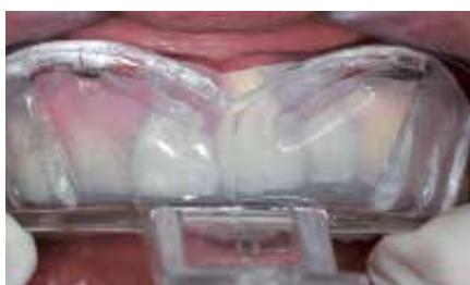
Criação da matriz com ELITE GLASS: deixe pelo menos 2 mm de silicone ao redor dos dentes*