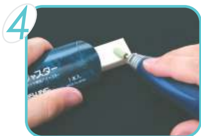
Pressione a ponta Dura-Green DIA contra o Esmeril Shofu, mantendo-a em rotação