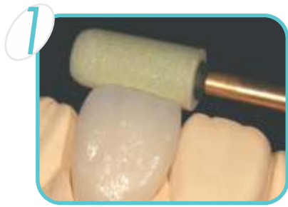
Cy5 – No. 70: Ajuste da Superfície Ajuste eficiente da superfície da coroa graças à excelente capacidade de corte