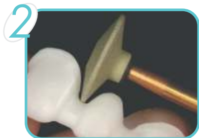
Kn7 – No. 10: Ajuste da Estrutura Ajuste da espessura da porcelana e do coping cerâmico