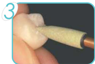
Tc4 – No. 20: Acabamento Detalhado Ideal para ajuste das cristas e da oclusão